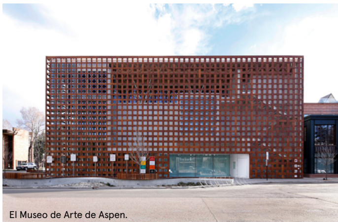
El Museo de Arte de Aspen.