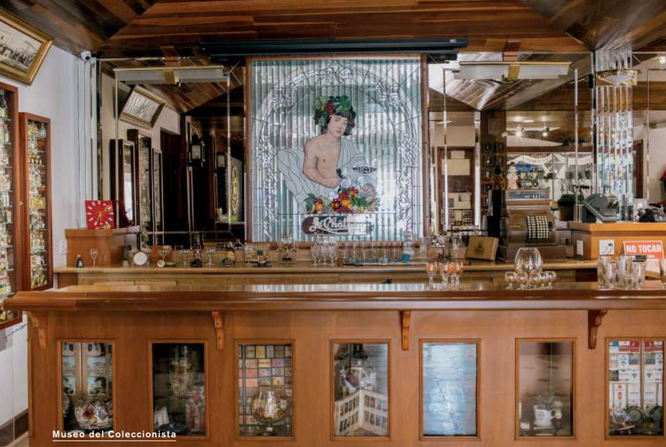
Museo del Coleccionista

Edición Judith Campiña . Textos Camilo Rodríguez . Diseño y mapa Ana Cecilia Vázquez . Fotografía Diego Berruecos . Traducción A Family Company . Corrección de estilo Diana Solano . Cotejo de información Isabel Gómez Aguado . Retoque digital Armando Ortega .