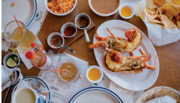
La Casa de la Langosta

El panorama abierto de la Carretera Escénica conduce a las animadas playas en las que, a pesar del frío, uno puede parar y dar un paseo para contemplar el paisaje. En La Misión hay que acercarse a Baja Excursions para cruzar el estero El Humedal en kayak o