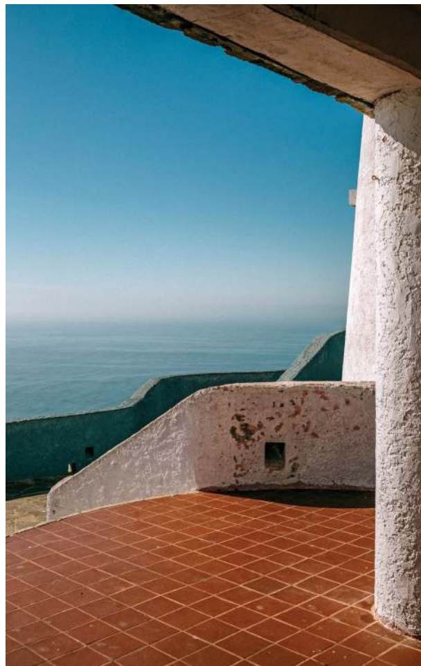
Mirador de la Carretera Escénica

Ensenada, Rosarito y Tecate son tres destinos que completan un panorama inmejorable y digno de una postal del estado. Hay que considerar alejarse un poco de la ciudad, darse tiempo de conocer una cara más tranquila de Baja California. Los alrededores de Tijuana, de verdad, no pueden ser más bellos.