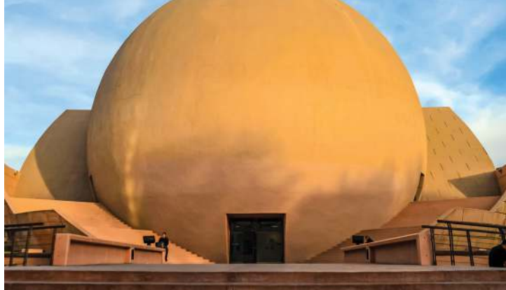
Centro Cultural Tijuana (Cecut)

Plaza Río, Galerías Hipódromo y Alameda Otay Town Center se han establecido en la ciudad como los referentes del comercio internacional. En los tres centros comerciales hay tiendas especializadas en accesorios tecnológicos, deportivos y de moda. Si se te olvidó empacar algo esencial, aquí vas a encontrar una buena selección a muy buenos precios. Hay además distintos colectivos gastronómicos, como Foodgarden, una red de artesanos culinarios conocidos por su oferta de taquerías, creperías y bistrós con oferta vegana.